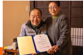
〈写真〉委嘱状を手にする京都府認知症応援大使の皆様